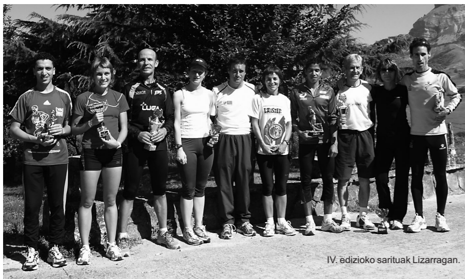
IV. edizioko sarituak Lizarragan.

Urtetik urtera gero eta ezagunagoa da Ergoienako Bira. Hori dela eta, Udala pozik dago lasterketarekin eta aurten ere gonbidatuko ditu korrikalariak parte hartzera. Aurtengoa bosgarren urtea izango da, eta zenbait berrikuntza egiten dira Ergoienako eta Sakanako korrikalarien parte hartzea bultzatzeko. 12-16 urte bitarteko gazteen parte hartzea ere sustatu nahi du Udalak, hori lortzeko gazteentzat erakargarri izan daitezkeen sariak eskaini nahi ditu. Aurreko urteetan egin bezala, bertako produktu ederrekin saritzen jarraitu nahi du Ergoienako Udalak. Aurtengo lasterketak Unanun izango du irteera eta helmuga.