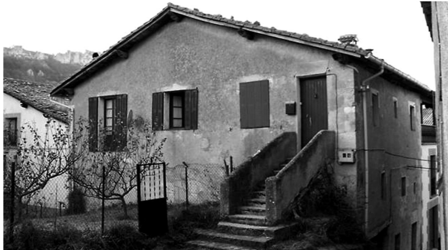
Dorraoko Kontzejuaren asmoa da kontzejuko etxe zaharra berritzea.

Bestetik, Lizarragan plaza berri bat egin nahi dute eta egitasmoa Hiru Urteko Planera aurkeztuko dute, diru-laguntza lortzeko esperantzarekin. Urtarrilaren 4an batzar bat deitu zuen Lizarragako Kontzejuak plaza berri bat egiteari buruz herritarren iritzia ezagutzeko, eta lizarragatarren iritzia baiezkoa izanenez, aurrera eramango du proiektua. Plaza berria Azi Iturri elkarte eta elizaren parean egonen litzateke eta lau-lau izanen litzateke.